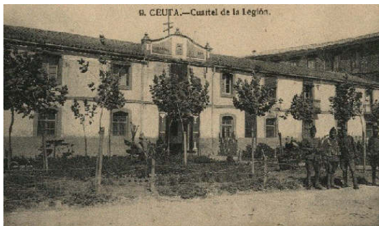
Fachada Cuartel del Rey

No dejamos de reconocer que la historia nos obliga a ello. Somos ciudadanos de esta Noble, Leal y Fidelísima Ciudad de Ceuta, y en ella, y más concretamente en el Cuartel del Rey, fue donde se alistó el primer Caballero Legionario y por tanto donde se fundó La Legión. Ninguna otra ciudad es más significativa para La Legión que Ceuta, y es en ella donde tenemos que conmemorarlo con nuestra Exposición.