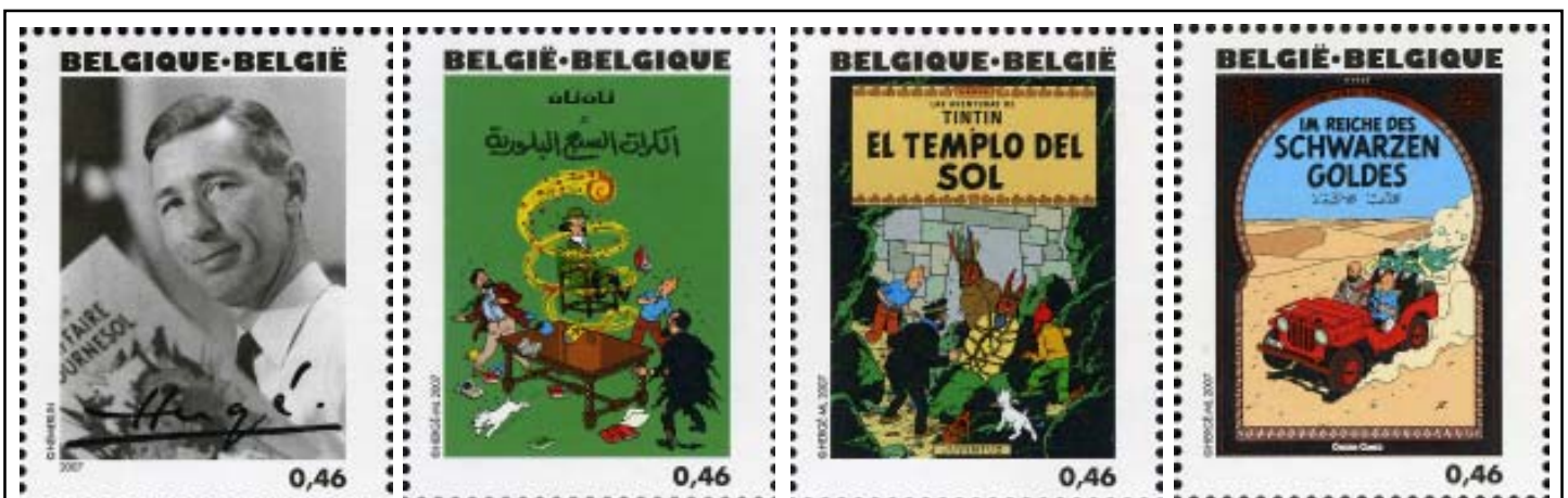
BÉLGICA 2007 - Centenario del Nacimiento de Hergé. Serie de 25 sellos en minipliego dedicada a los álbumes de Tintín, en las distintas lenguas en que se han publicado las historias: Retrato y firma autógrafa de Hergé - Las 7 bolas de cristal - El templo del Sol - Tintín en el país del oro negro

En el primer congreso del cómic de Nueva York (1972) se le concedió a Hergé el primer premio al conjunto de su obra; a partir de ahí los honores y reconocimientos llegarían de manera regular. En 1976 fue inaugurada una bella escultura de Tintín y Milú en el parque de Wolvendael (Uccle, Bruselas). En 1982 la Sociedad Belga de Astronomía bautizó con su nombre artístico