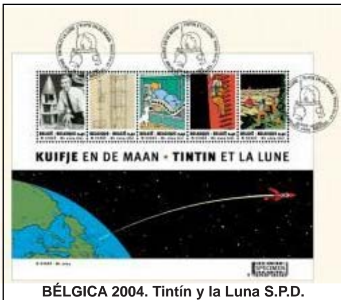
BÉLGICA 2004. Tintín y la Luna S.P.D.

La primera emisión apareció en los años setenta, le siguieron otros sellos en Bélgica, Congo, Francia, Holanda, etc. Por supuesto, podrían haber sido muchos más, pero Tintín no deja de ser una marca comercial y sus propietarios preservaron su patrimonio: no concedieron facilidades para inmortalizar su obra en el mundo postal. A lo sumo las editoriales en los respectivos países emplearon su imagen para realizar franqueos mecánicos y sobres entero postales que, en algunos casos, son sumamente buscados por los especialistas en este incansable viajero del siglo XX. En muchos casos las piezas que escaparon a la destrucción son pocas y su rareza aumenta a medida que los aficionados al legado o Tintín-manía aumentan.