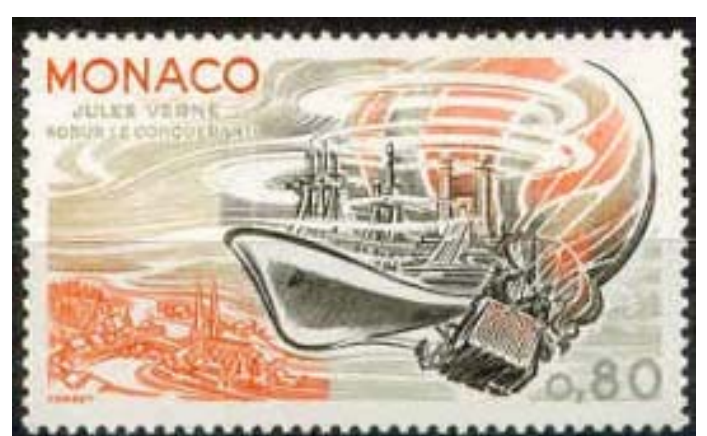
MÓNACO 1978 - 150 Aniversario del Nacimiento de Julio Verne