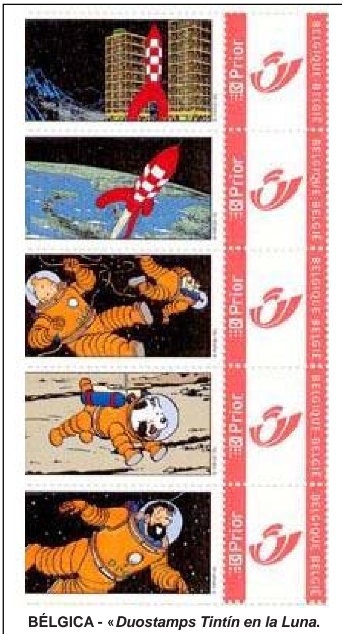
BÉLGICA - «Duostamps Tintín en la Luna.»

El año del centenario, al momento de dar por cerrado el trabajo, teníamos conocimiento de las emisiones realizadas por tres administraciones postales: Bélgica, 25 sellos (uno por álbum y en el centro de