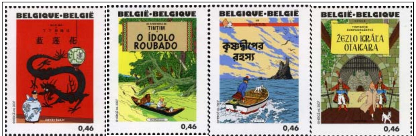
BÉLGICA 2007 - Centenario del Nacimiento de Hergé. Serie de 25 sellos en minipliego dedicada a los álbumes de Tintín. Los títulos aparecen en las distintas lenguas en que se han publicado las historias: El loto azul - La oreja rota - La isla negra - El cetro de Ottokar

cebarse en las gentes del continente negro, aunque las cosas se quieran disfrazar con mil y un adjetivos). Por supuesto, nada de lo que sucedía en aquella peculiar y personal finca del rey Leopoldo se dejaba entrever en la historia que hoy podríamos decir fue hecha por encargo de la empresa en la que trabajaba.