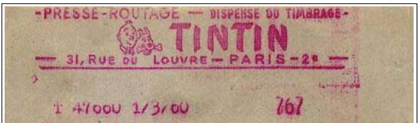
FRANCIA. 01.031960 Gomígrafo publicitario indicando franquicia de porte