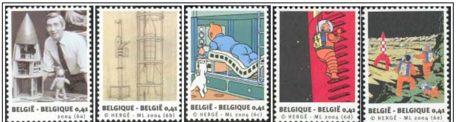
BÉLGICA 2004 - Tintín y la Luna. Emitidos en hoja bloque