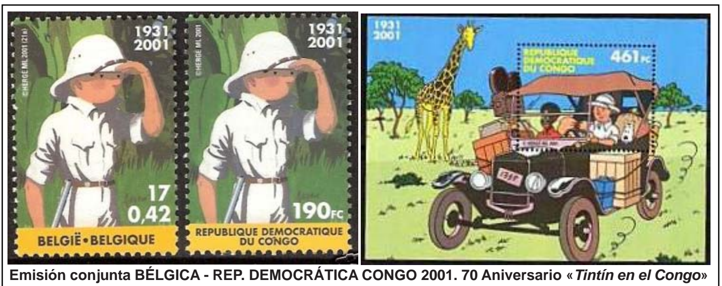
Emisión conjunta BÉLGICA - REP. DEMOCRÁTICA CONGO 2001. 70 Aniversario «Tintín en el Congo»

sello de correos), algo que podríamos llamar lógico puesto que en aquella época el Congo era una colonia belga. El abad quería divulgar en sus páginas la labor misional en África (años más tarde llegarían esas interminables arengas contra las metrópolis; tras la II Guerra Mundial, los clásicos bloques y sus influencias, luego la descolonización; ahora tenemos el constante, y sangrante, trasvase de africanos en esta nueva era globalizadora de esclavitud económica que no deja de