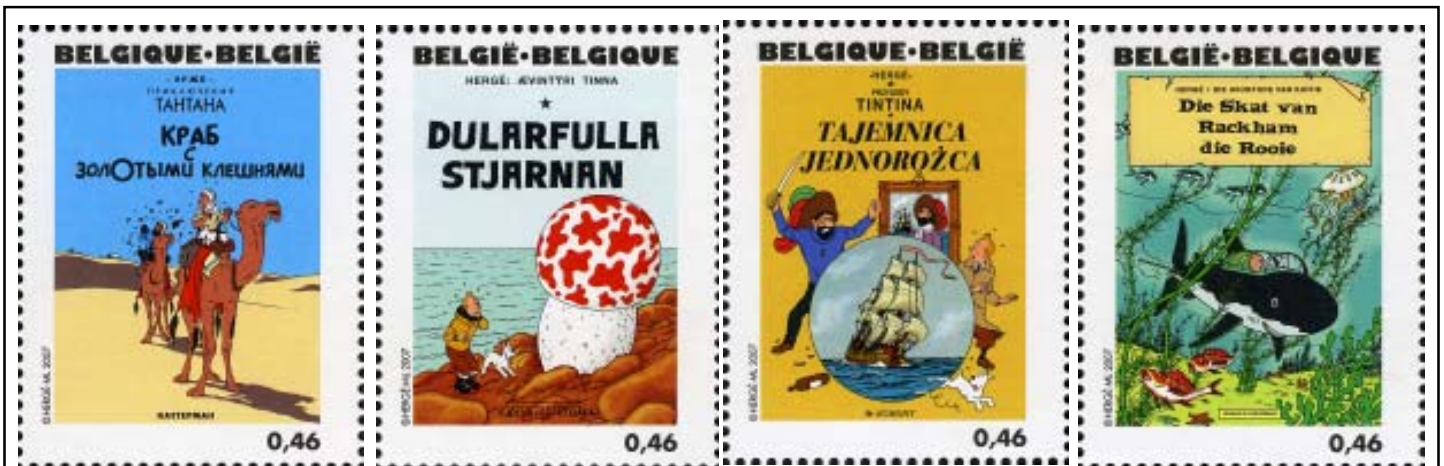
BÉLGICA 2007 - Centenario del Nacimiento de Hergé. Serie de 25 sellos en minipliego dedicada a los álbumes de Tintín, en las distintas lenguas en que se han publicado las historias: El cangrejo de las pinzas de oro - La estrella misteriosa - El secreto del Unicornio - El tesoro de Rackham el Rojo

el resto de personajes habituales en las historietas de Hergé. Participó asimismo en la creación teatral con dos obras presentadas en Bruselas (1941 y 1941/42): Tintín en la India y La desaparición de Mr. Boullcock . A finales de los setenta y ochenta también se realizaron en Londres. En el XXI de nuevo hubo representaciones teatrales en Bélgica: Las siete bolas de cristal y El templo del Sol (15/9/2001, Teatro Municipal de Amberes). Para el año del centenario estaba programada Tintín en el Tíbet , que se había representado en Londres en diciembre 2005 y enero 2006.