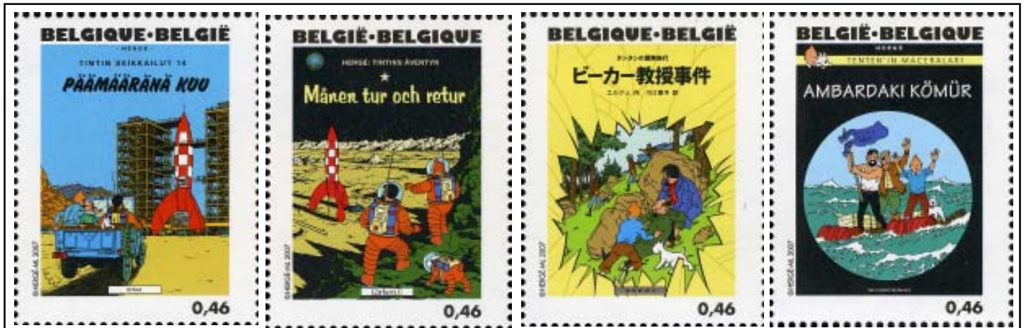
BÉLGICA 2007 - Centenario del Nacimiento de Hergé. Serie de 25 sellos en minipliego dedicada a los álbumes de Tintín, en las distintas lenguas en que se han publicado las historias: Objetivo la Luna - Aterrizaje en la Luna - El asunto Tornasol - Stock de Coque

el planeta descubierto por Silvain Arond en 1953.