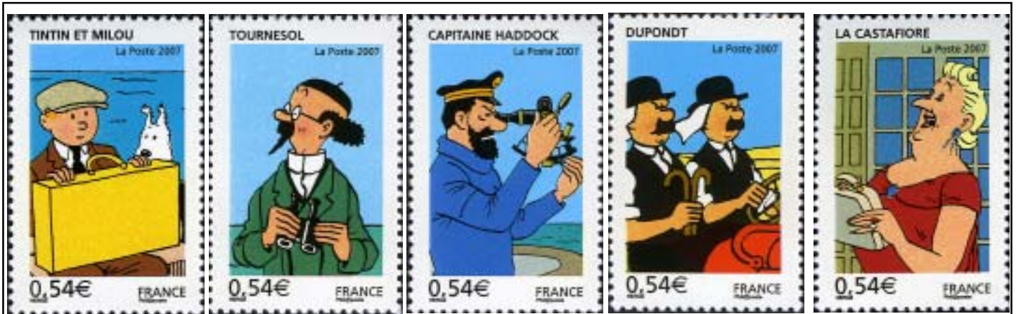
FRANCIA 2007. Centenario del Nacimiento de Hergé. Serie dedicada a la Cruz Roja Francesa compuesta de 6 sellos con personajes de las historietas de Tintín. Emitida en hoja bloque