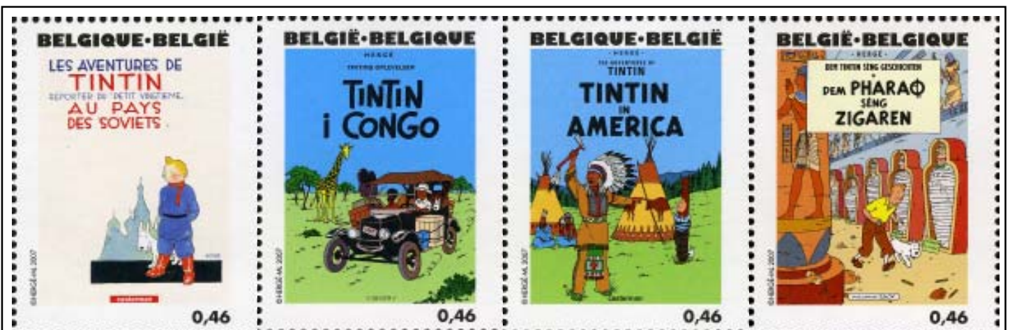
BÉLGICA 2007 - Centenario del Nacimiento de Hergé. Serie de 25 sellos en minipliego dedicada a los álbumes de Tintín. Los títulos aparecen en las distintas lenguas en que se han publicado las historias Tintín en el país de los soviets - Tintín en el Congo - En América - Tintín y los Cigarros del Faraón

famoso Tintín: El país de los soviets , duramente atacado por la izquierda europea que prácticamente lo ignoró (cuando no lo boicoteó) durante décadas. ¡La falta de libertad viene de lejos! Aunque no sea precisamente el mejor, sí era el inicio de un formato que se iría consolidando con el tiempo y aquella primigenia aventura en la Unión Soviética fue dando paso a materiales de gran interés no sólo literario, sino sociológico, arquitectónico, costumbrista o vanguardista en una sociedad en constante mutación. Hergé se fue dotando de una ingente cantidad de libros e imágenes que, con su desaparición, pasaron a ser buscados por historiadores y curiosos que rastrean el universo en que