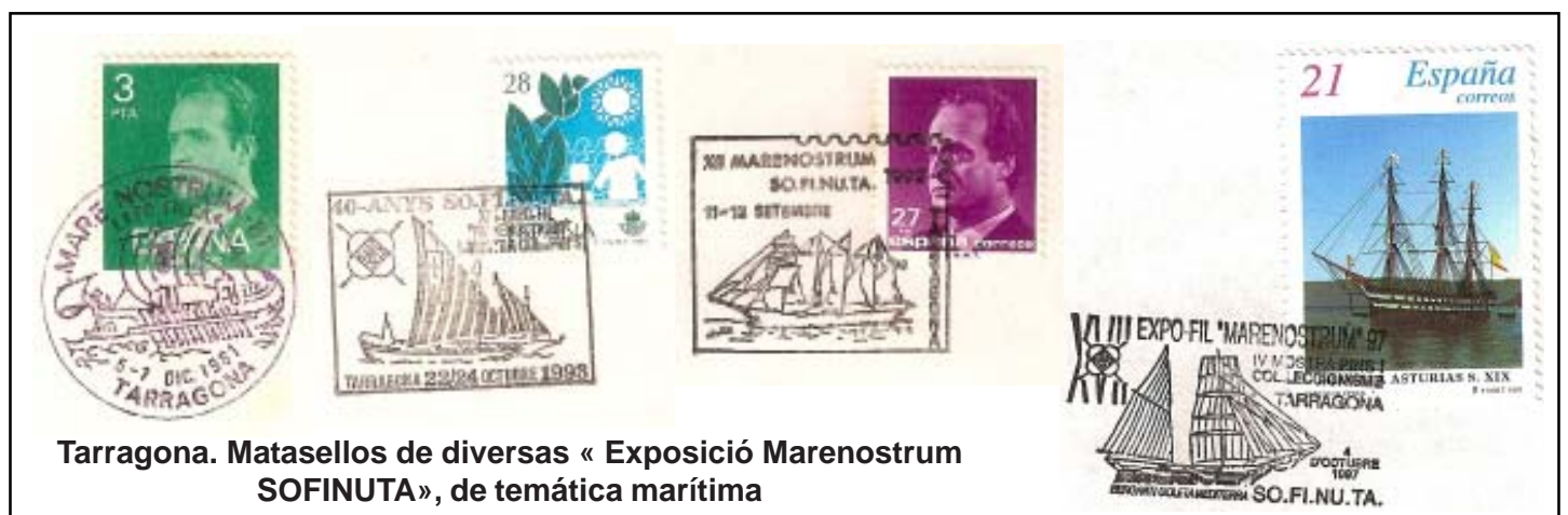
Tarragona. Matasellos de diversas «Exposició Marenostrium SOFINUTA», de temática marítima

Sin duda, el elemento sobre el que se fundamentó el desarrollo de Tarraco fue su PUERTO ; eje básico del comercio de esta ciudad con el orbe romano. Esta vocación marítima de la ciudad de Tarragona ha sido profusamente puesta de relieve en los matasellos empleados en las distintas exposiciones filatélicas celebradas en dicha ciudad y cuyas improntas dan testimonio de la evolución histórica de las embarcaciones que surcaron el Mediterráneo y anclaron en sus muelles.