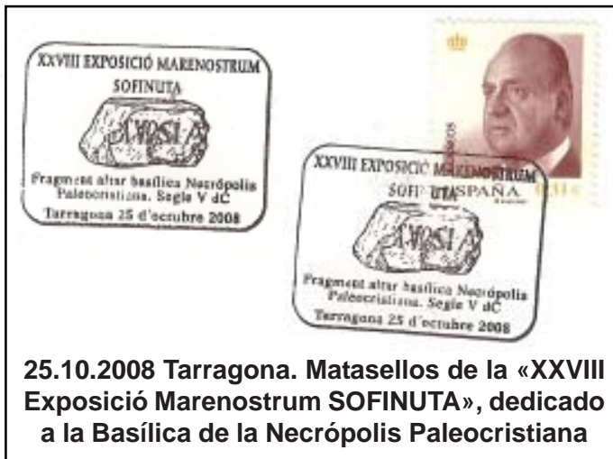
25.10.2008 Tarragona. Matasellos de la «XXVIII Exposició Marenostrium SOFINUTA», dedicado a la Basílica de la Necrópolis Paleocristiana

mente se desarrollaría una NECRÓPOLIS en torno a ella. En el matasellos de la « XXVIII EXPOSICIÓ MARENOSTRUM SOFINUTA. TARRAGONA 25 d'octubre 2008 » se reproduce la imagen de un fragmento del altar de dicha basílica martirial con una inscripción dedicada a San Fructuoso.