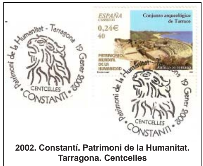
2002. Constantí. Patrimoni de la Humanitat. Tarragona. Centcelles

el motivo elegido en sendos matasellos manuales empleados en el municipio de Constantí: