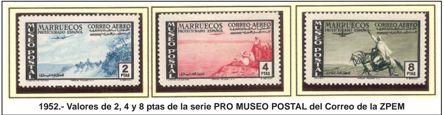
1952.- Valores de 2, 4 y 8 ptas de la serie PRO MUSEO POSTAL del Correo de la ZPEM

ñol en Marruecos y otras dependencias postales.