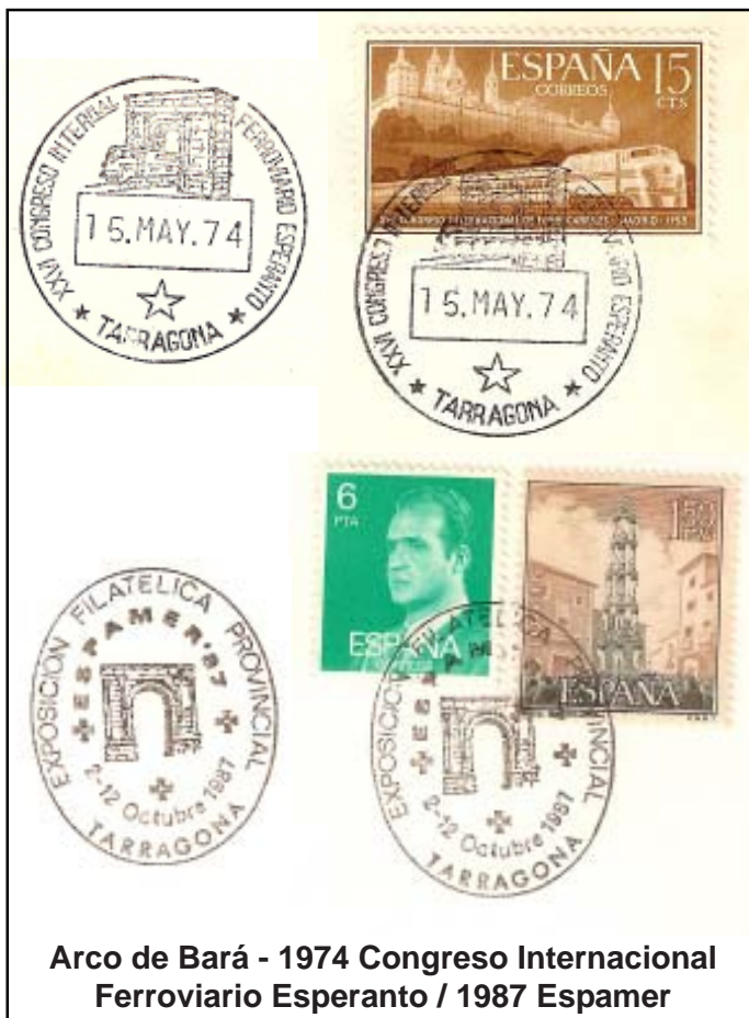
Arco de Bará - 1974 Congreso Internacional Ferroviario Esperanto / 1987 Espamer

TARRAGONA ». Matasellos manual de la exposición España-América.