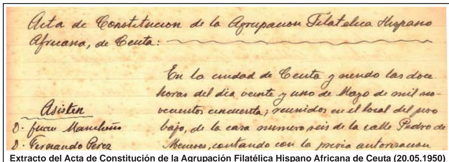
Extracto del Acta de Constitución de la Agrupación Filatélica Hispano Africana de Ceuta (20.05.1950)