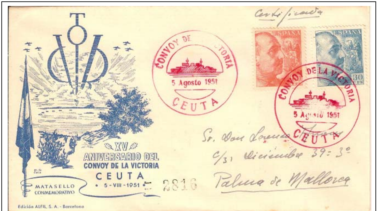
Carta certificada circulada a Palma de Mallorca cancelada con el matasellos conmemorativo del CONVOY DE LA VICTORIA. CEUTA. 1951, estampado con TINTA ROJA. Sobre ilustrado por Alfíl.

10+15 pesetas, lo que produjo cierta alarma entre los coleccionistas filatélicos. En reunión celebrada en Tetuán en la Delegación de Obras Públicas y Comunicaciones, de la que dependía la Inspección de Correos de la ZPEM, los representantes de nuestra Agrupación Filatélica Hispano Africana de Ceuta y de la Sociedad Filatélica Hispano Marroquí de Tetuán expusieron sus razones contrarias a este tipo de emisión. A pesar de ello, y dado el carácter recaudatorio que desde un principio las autoridades postales impusieron a la misma, se acordó que en vez de un sello con sobretasa se emitirían 4 sellos