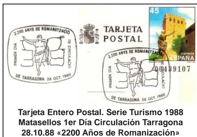
Tarjeta Entero Postal. Serie Turismo 1988 Matasellos 1er Día Circulación Tarragona 28.10.88 «2200 Años de Romanización»

EL EMPERADOR CAYO JULIO CÉSAR OCTAVIANO AUGUSTO fue un gran benefactor e impulsor del crecimiento de Tarraco. Residió en la ciudad (26-25 a.C.) y desde allí dirigió la pacificación de Gallaecia y Astúrica. Consolidó la posición de Tarraco como capital de la Hispania Citerior.