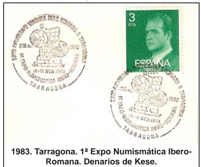
1983. Tarragona. 1ª Expo Numismática Ibero-Romana. Denarios de Kese.

Los pobladores ÍBEROS que ocupaban el territorio en el S. V-IV a.C., OPPIDUM KESE , con anterioridad a la llegada de los Escipiones (Cneo y Publio Cornelio) funda-