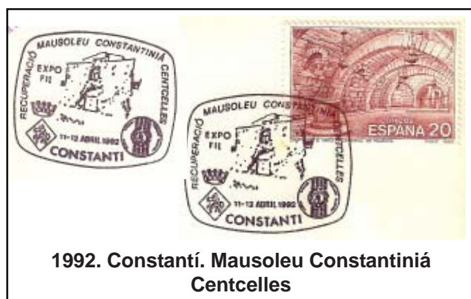
1992. Constantí. Mausoleu Constantiniá Centelles

La VILLA MAUSOLEO DE CENTCELLES , a 4'6 km de Tarraco, fue construida a inicios del S. IV d.C. Una de las salas fue transformada en mausoleo y presenta riquísimos mosaicos de diversas temáticas entre las que destaca una gran escena de caza con cuatro personales entronizados, lo cual ha abonado la hipótesis de que el destinatario del mausoleo pudiera ser el Emperador Constante (320-350 d.C). Fue