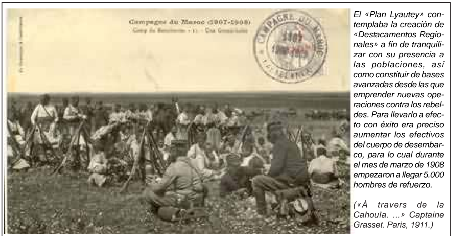
El «Plan Lyautey» contemplaba la creación de «Destacamentos Regionales» a fin de tranquilizar con su presencia a las poblaciones, así como constituir de bases avanzadas desde las que emprender nuevas operaciones contra los rebeldes. Para llevarlo a efecto con éxito era preciso aumentar los efectivos del cuerpo de desembarco, para lo cual durante el mes de marzo de 1908 empezaron a llegar 5.000 hombres de refuerzo.

la evolución de los acontecimientos. El 1.04.08 se establece el Campamento Boucheron en el cual se instala el Destacamento Regional de los M'Dakra (D.R.M) encargado de pacificar dicho territorio y que contará con una oficina postal militar (Trésor et Postes). También se instala una oficina postal en Ber-Rechid en abril.08, debido a la importancia estratégica de dicho punto respecto de las operaciones militares que se están llevando a cabo en ese momento. Con independencia de las oficinas instaladas en campamentos, habrá otras estafetas móviles que acompañan a las columnas de operaciones. Así, el 4.04.08 se organiza una fuerza móvil compuesta de 2 brigadas con el objetivo de la reocupación de Settat, y a la cual se le afecta una estafeta postal militar (Trésor et Poste). También acompañó una estafeta postal a la columna (27.06.08) encargada de calmar la situación en Azemmour y restablecer las comunicaciones con Mazagán, y con lo cual se dará fin a los acontecimientos conocidos como los «Sucesos de Casablanca». (Continuará)