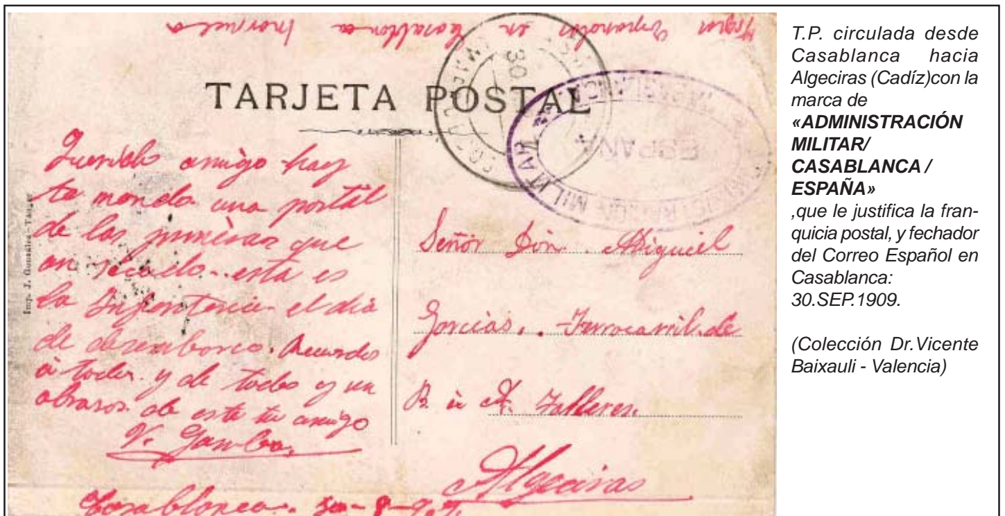
T.P. circulada desde Casablanca hacia Algeciras (Cádiz) con la marca de « ADMINISTRACIÓN MILITAR/ CASABLANCA / ESPAÑA », que le justifica la franquicia postal, y fechador del Correo Español en Casablanca: 30.SEP.1909.

ovalada y con estampación violeta porta la leyenda « ADMINISTRACION MILITAR * CASABLANCA* / ESPAÑA ». Hay que hacer constar que sobre los miembros de